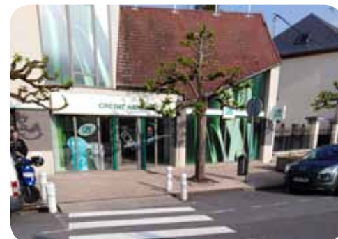
Passage protégé rue Hôtel de ville

Rappel : Le stationnement des véhicules est interdit sur les trottoirs (article 417-11 du code de la route) et sanctionné d'une amende de 135 €. De plus lorsque celui-ci empêche la circulation des piétons, des personnes à mobilité réduite et qu'il provoque une gêne à la visibilité pour la sortie des véhicules des propriétés, la responsabilité du conducteur du véhicule peut être engagée en cas d'accident.