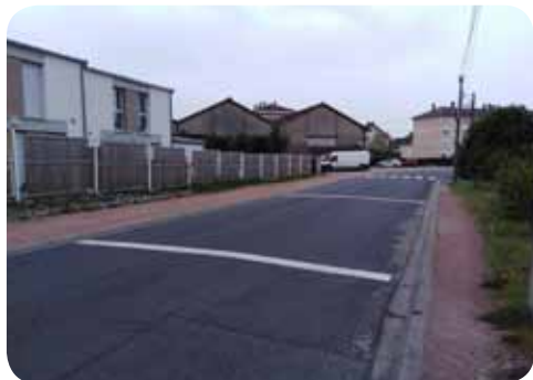
Bandes rugueuses vers Carrefour Market