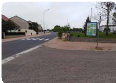
Passage protégé Brémonts - AFN