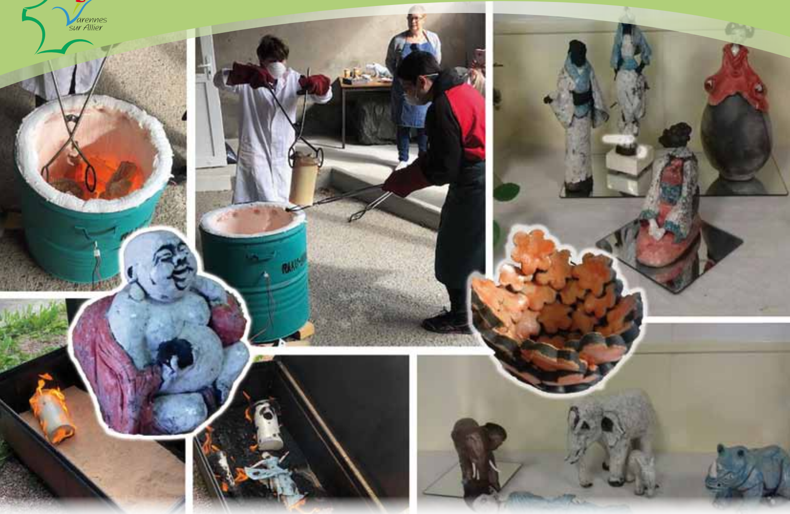
Technique du RAKU avec l'association Académie d'Art Jean-Pierre PERRIN