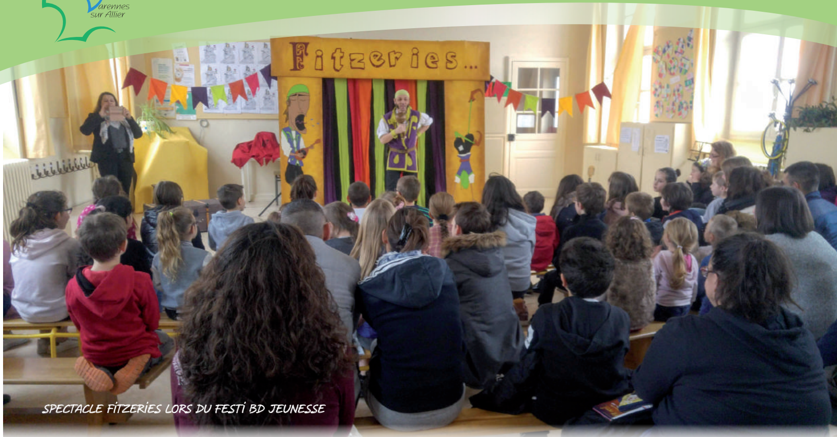
SPECTACLE FITZERIES LORS DU FESTI BD JEUNESSE