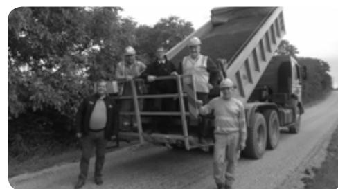
Chemin des Cailloux

Des travaux de voirie ont été réalisés par l'entreprise « COLAS » dans le cadre de la réhabilitation des rues du Moulin Vaque, des Haies basses, des chemins des Cailloux et des Andrivaux.