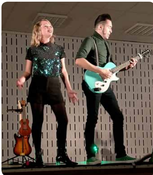
Les Mirabelles Kitchen

N'hésitez pas, devenez actifs dans le développement de l'activité culturelle afin de créer une dynamique (laissez-nous vos coordonnées si vous le souhaitez pour qu'on puisse vous joindre).