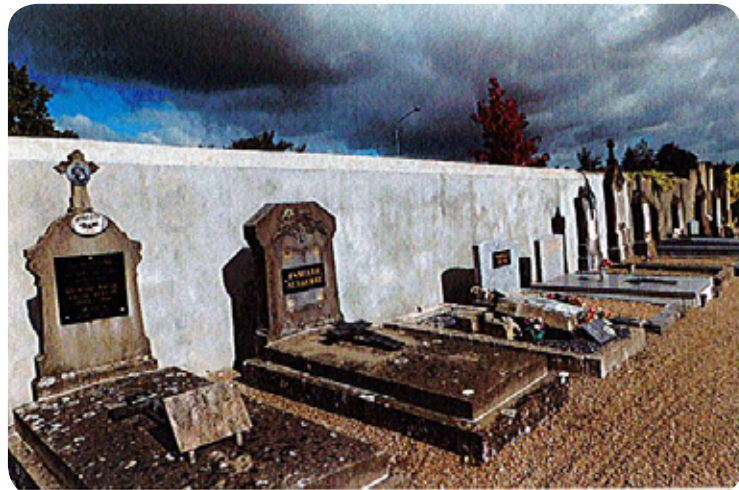
Suite à un accident, des sépultures avaient été endommagées. La commune a procédé aux réparations où cela était juridiquement possible

Il est possible pour un concessionnaire de devoir effectuer le renouvellement de sa concession avant la date d'échéance : lorsqu'un défunt doit être inhumé dans une concession pendant les cinq dernières années avant l'échéance, la commune demande généralement que le renouvellement ait lieu avant l'inhumation.