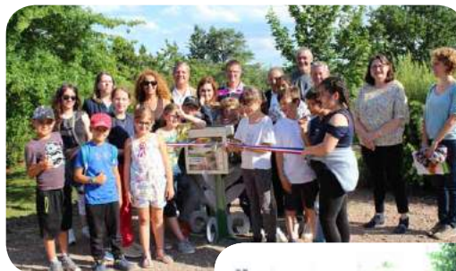
Parc des Rouettes

Projet du Conseil municipal d'enfants et de jeunes