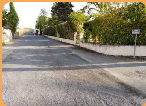
Chemin des Andrivaux