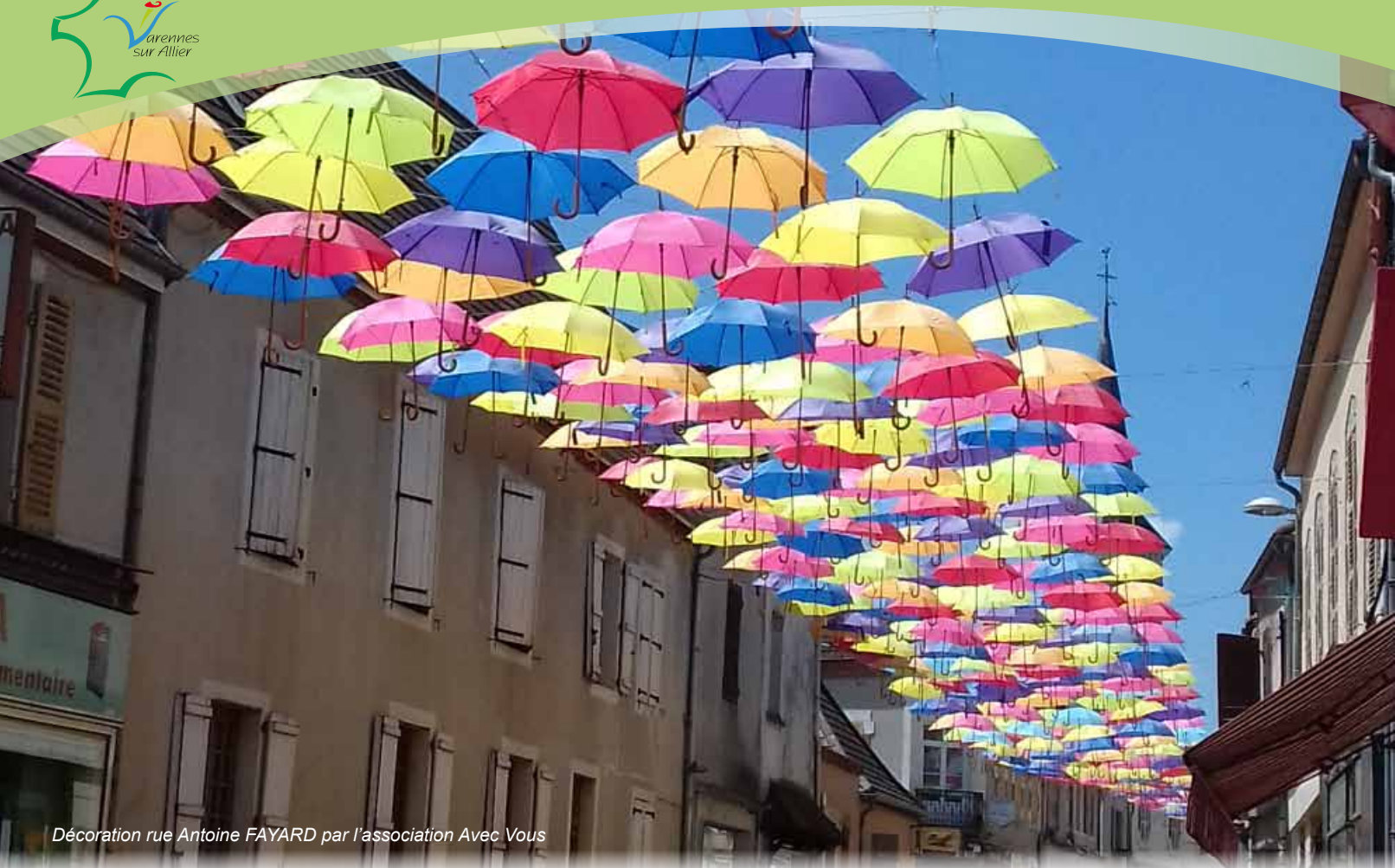
Décoration rue Antoine FAYARD par l'association Avec Vous