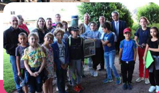
Square de Vouroux et le jardin du Glaude