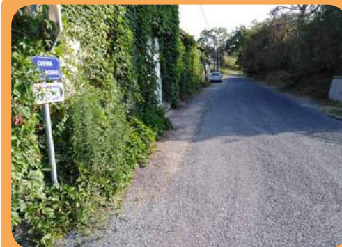
Chemin de la Robine

Suite aux travaux d'assainissement sur le secteur Sud de la commune, les voies de communications ont été remises en état : rues du Moulin Vaque, des Haies Basses, chemins des Andrivaux et de la Robine.