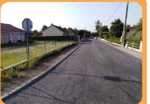
Rue du Moulins Vaque

Les travaux se poursuivent secteur Nord dans les rues du Bourbonnais et d'Île de France. Secteur Sud quartier Montloubet et des Luteaux, ainsi que dans le centre-ville rue du 4 septembre.