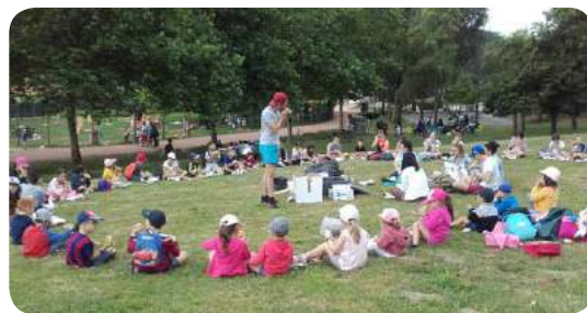
Lac des sapins

En moyenne une soixantaine d'enfants ont fréquenté l'accueil tous les jours en juillet. Les activités proposées avaient pour thème : « les globe-trotters partent à l'aventure ».