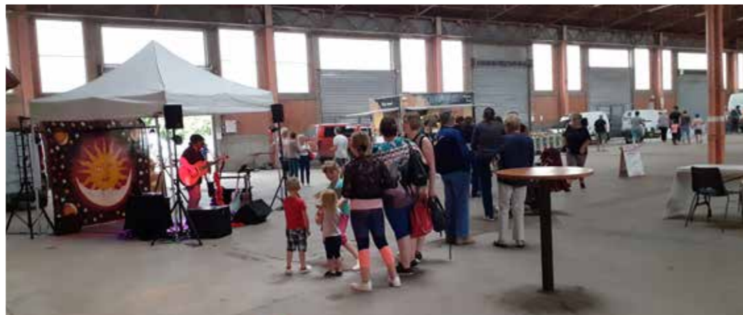
Marché des producteurs de pays

Avec le transfert du FabLab et la mise en oeuvre de l'hôtel d'entreprises artisanales, les prochains chantiers devraient également concerner la redynamisation de la base vie dès que nous en serons propriétaires, en principe au 1 er trimestre 2023.